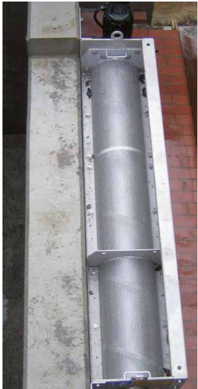
Einsatz einer HUBER Siebanlage ROTAMAT® RoK2 in einem Entlastungsbauwerk.

Die Siebanlage ist unmittelbar vor der Überlaufschwelle des Entlastungsbauwerkes horizontal angeordnet und besteht aus einer 180° gewölbten Siebfläche mit integrierter Schneckenwendel. Während eines Entlastungsereignisses wird die Siebanlage von unten nach oben durchströmt und die abgetrennten Feststoffe durch eine Schneckenwendel mit Bürstenbesatz während der automatischen Zwangsreinigung der Siebfläche verpressungsfrei und schonend zur seitlichen Austragsöffnung transportiert. Das Siebgut verbleibt anschließend auf der Zulaufseite der Siebanlage und wird mit dem weiterführenden Abwasserstrom abtransportiert. Während des Entlastungsereignisses aktiviert sich die Siebanlage selbstständig und arbeitet vollautomatisch.