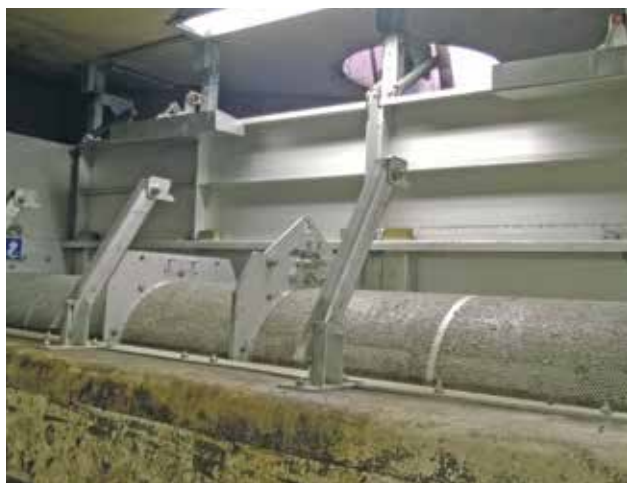
HUBER Siebanlage ROTAMAT® RoK2 - Optionale Ausführung mit Notentlastungsklappe.