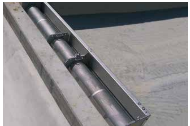
HUBER Siebanlage ROTAMAT® RoK2 nach erfolgter Montage.