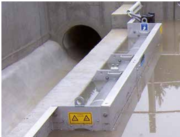
HUBER Siebanlage ROTAMAT® RoK2 vor dem Entlastungsbeginn.

Überzeugen Sie sich von der HUBER Siebanlage ROTAMAT® RoK2 anhand der untenstehenden Anwendungsbeispiele.