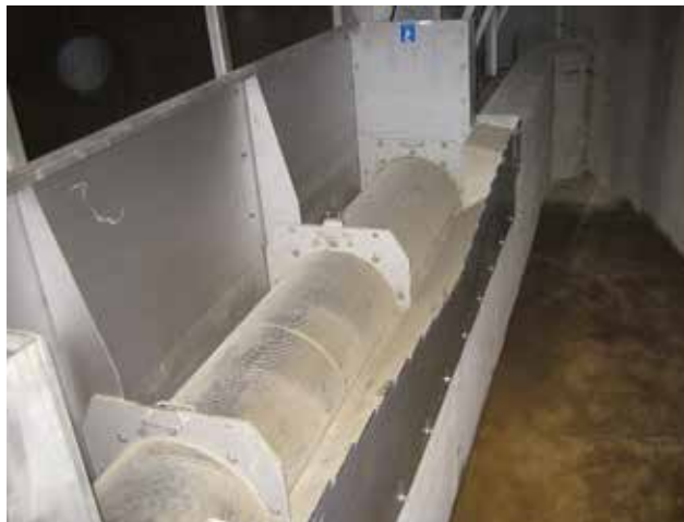
HUBER Siebanlage ROTAMAT® RoK2 mit einer integrierten Messwehr zur Entlastungsmengenmessung.