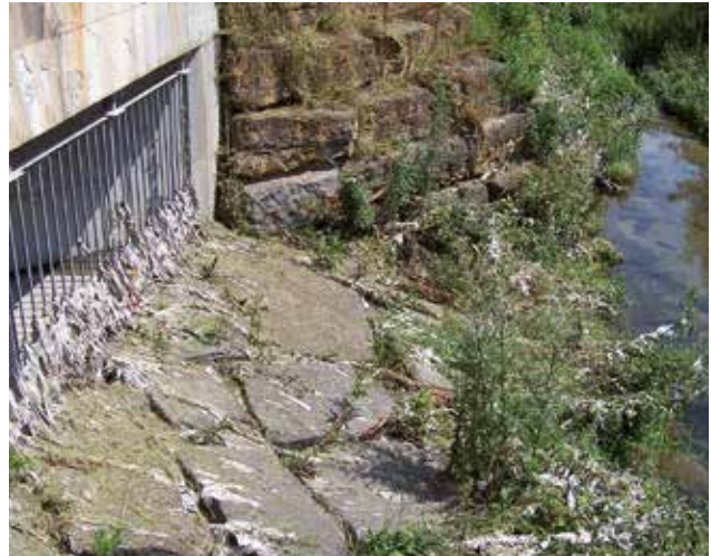
Typisches Bild eines Regenauslassbauwerkes ohne Grobstoffrückhalt nach einem Entlastungsereignis.

Die ausgetragenen Stoffe wie Hygieneartikel, Toilettenpapier, Fäkalien, Plastikfolien etc. verursachen dort oft einen unschönen Anblick sowie erhebliche Reinigungs- bzw. Entsorgungskosten. Basierend auf dem DWA-Arbeitsblatt A 128 werden verstärkt Anstrengungen unternommen, den Gewässerschutz in diesem Bereich grundlegend zu verbessern. Für besonders gefährdete Vorfluter sowie in Naturschutzgebieten werden weitergehende Regenwasserbehandlungsmaßnahmen vorgeschrieben.