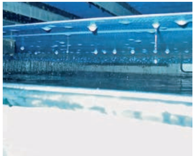
Blick in den Filtratraum.