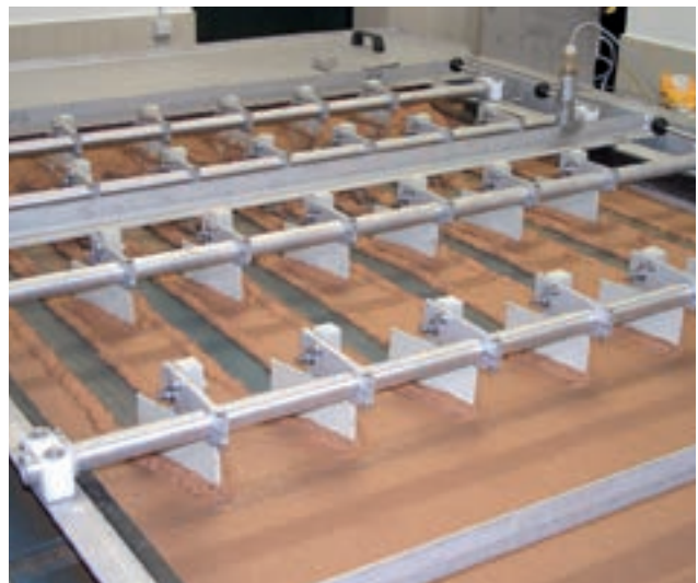
Eindickung von Molkereischlamm.