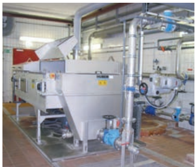
Bandeindicker für 60 m 3 /h Dünnschlamm.