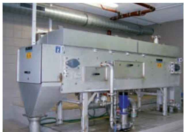
Mit eigenem Filtrat gespeiste Spritzwasserpumpe.