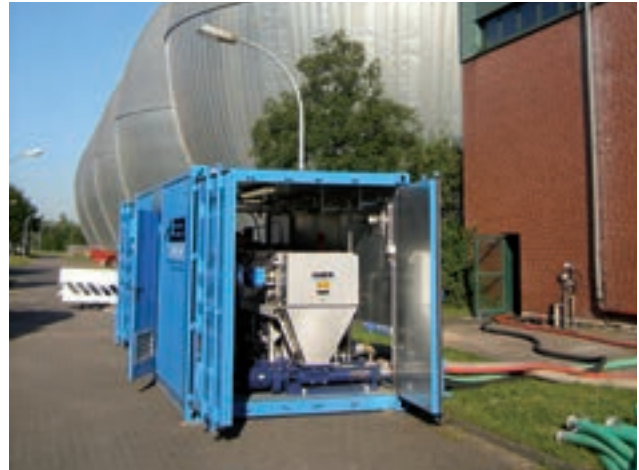
Mobile Vorführanlage im Container.