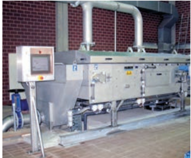
HUBER Bandeindicker DrainBelt für bis zu 100 m 3 /h Dünnschlamm.