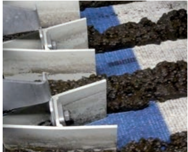
Schwimmende Schikanen schichten den Schlamm um und schaffen freie Siebfläche für den Filtrat Ablauf.