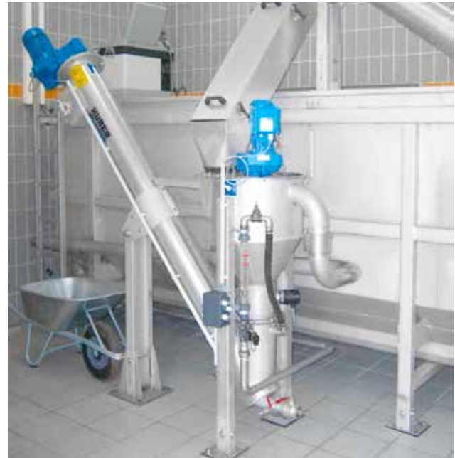
Kleine HUBER Sandwaschanlage RoSF4 TC wäscht klassierten Sand aus einer HUBER Kompaktanlage ROTAMAT® Ro5.