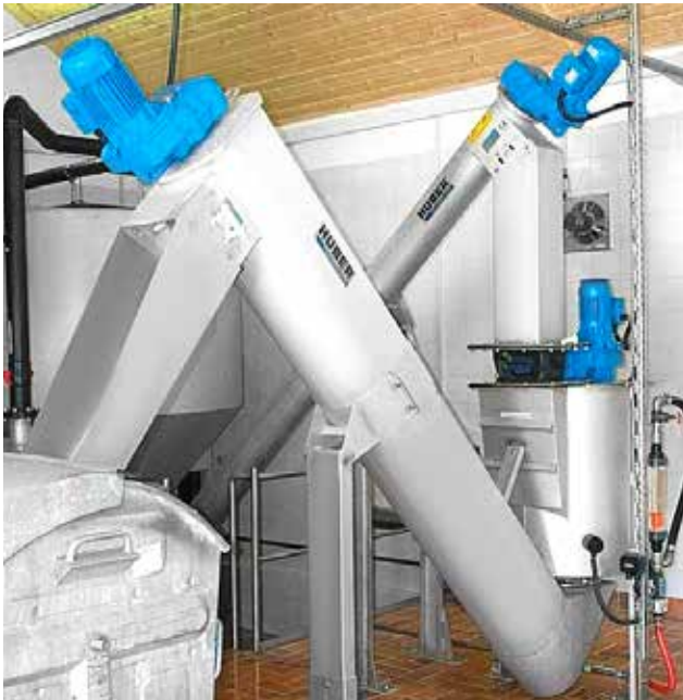
Die HUBER Sandwaschanlage RoSF4 T wäscht klassierten Sand aus einem HUBER Rundsandfang HRSF.

Die organischen Bestandteile werden automatisch mit dem eingebrachten Waschwasser aus der Anlage geschwemmt.