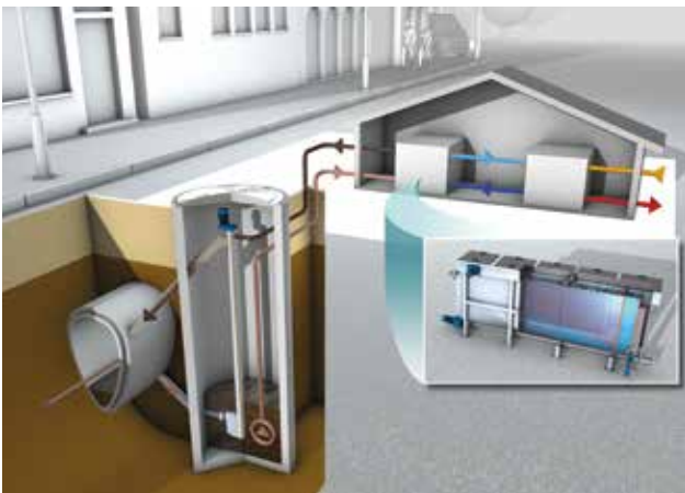
Umweltfreundliche Wärmeversorgung für Gebäude: HUBER ThermWin®-Verfahren mit HUBER Abwasserwär- metauscher RoWin.