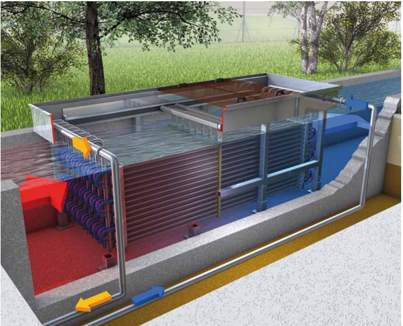
Einsatz des HUBER Abwasserwärmetauschers RoWin C im Betonbecken. Der Wärmeüberträger wird im Freispiegel durchströmt.

und die Wirtschaftlichkeit einer solchen Anlage deutlich verbessert. Gerade im Hinblick auf die energetische Sanierung von Kläranlagen kann der HUBER Abwasserwärmetauscher RoWin einen entscheidenden Beitrag leisten. Die kompakte Bauweise und die Aufstellung in einem Gerinne oder einem Becken verursachen keinen zusätzlichen Platzbedarf, womit die örtlichen Verhältnisse bestmöglich ausgenutzt werden. Eine Nutzung des Kläranlagenablaufes schließt eine Biofilmbildung auf den Wärmeübertragerflächen jedoch nicht gänzlich aus. Deshalb stellt die automatisierte Reinigungseinrichtung der Tauscherröhre weiterhin einen zentralen Punkt für eine dauerhafte und maximale Wärmeübertragungsleistung dar. Die Möglichkeit die Wärmetauscher parallel oder in Reihe zu verschalten, eröffnet ideale Anpassungsmöglichkeiten an Becken- und Abwasserhältnisse. Befahrbar abdeckungen ermöglichen einen Einbau der Anlage beispielsweise unter Parkflächen.